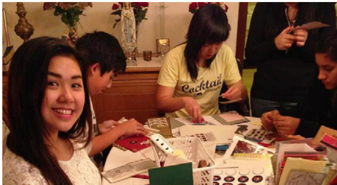
Foto: Gerhard Raphael Abad Balagat fra Ungdomslaget Dueflokket fra Drammen