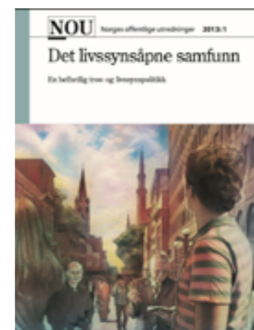
Rapporten kan leses på www.regjeringen.no NKRs høringsuttalelse finnes i sin helhet på www.nokr.no

Dagens religiøse mangfold var utenkelig i 1814. I det livssyns åpne samfunnet er ikke tro- og livssynsdimensjonen et privatisert tabu. Den anerkjennes som en vesentlig del av menneskers personlige, sosiale og kulturelle identitet.