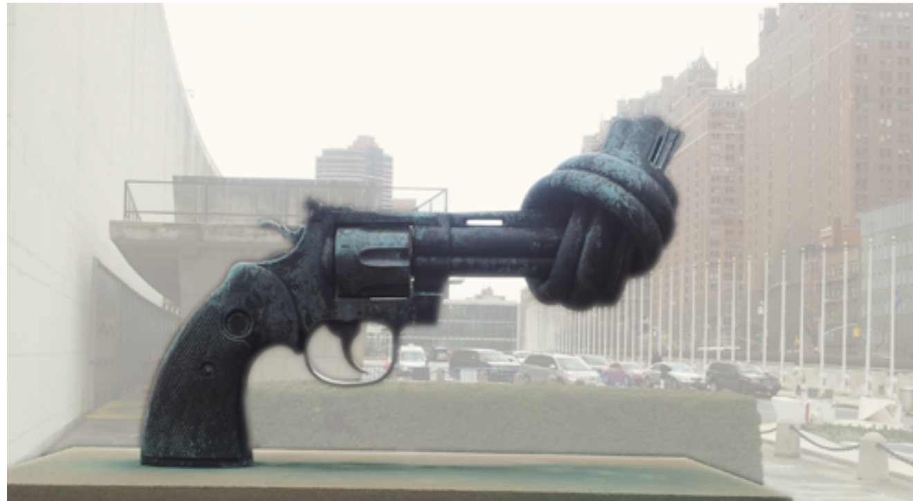
Skulpturen 'Non-violence' utenfor FN-bygget i New York.