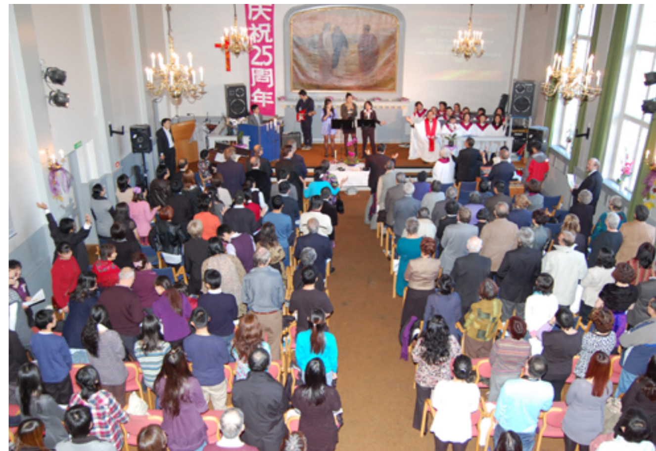
Foto: Gudstjeneste i Scandinavian Chinese Church of Oslo, en av de større migrantmenighetene.

Kristne innvandrere møter det norske kirkeliv og samfunn på ulike måter. På mindre steder oppsøker mange fellesskap i eksisterende menigheter, mens i byene dannes det ofte egne menigheter eller fellesskap. Disse menighetene kalles «migrantmenigheter». Dette er et relativt nytt (og internasjonalt) fenomen. I noen migrantmenigheter samles mennesker med felles språk og/eller nasjonalitet, mens i andre regnes som internasjonale menigheter og bruker engelsk som gudstjenestespråk. Menighetene varierer i grad av organisering. De mest etablerte er registrert