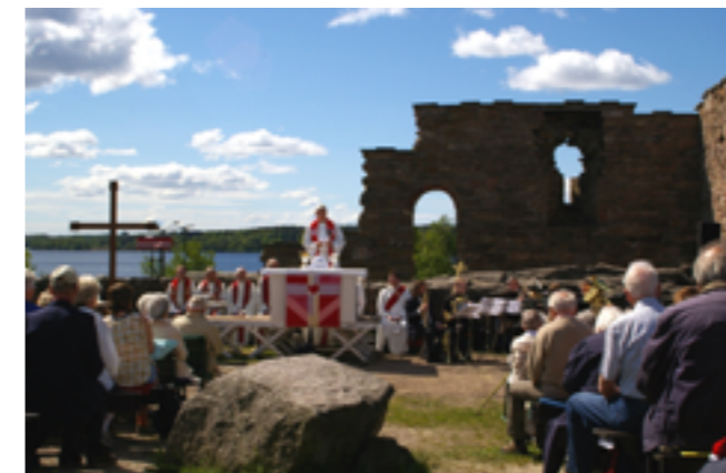
Økumenisk friluftsgudstjeneste i Maridalen.

Hvilke linker finnes mellom økumenikk sentralt og lokalt? Og hva er Norges Kristne Råds rolle i dette?